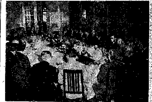
Almoço oferecido pelo dr. Miguel Couto Filho, ministro de Saúde do Brasil ao dr. Joseph Serlin, ministro de Saúde de Israel.

PARIS, (JTA) — A União Mundial do OSE anunciou a concessão de bolsas de estudo e pesquisas de medicina e ciências associadas a pessoas que trabalham ativamente em instituições judias e desejem continuar seus estudos na França ou no exterior.