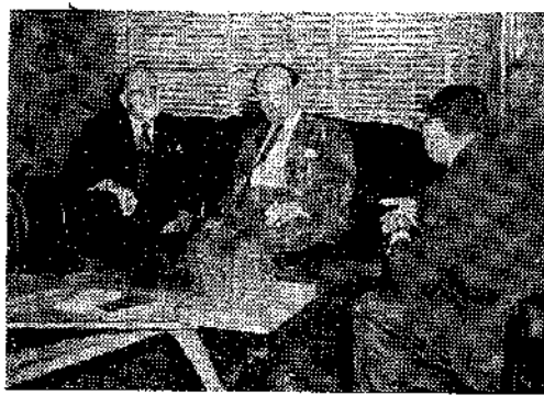
Recepção do dr. Miguel Couto Filho, ministro de Saúde do Brasil, ao dr. Joseph Serlin, ministro de Saúde de Israel.

Na capital da República representa a coluna vertebral brasileira onde vive uma das de sua segurança e sua estabilidade territorial. Na pasta da Saúde o ilustre visitante cuja posição é defender a higiene e ao mesmo tempo conservar sadio o