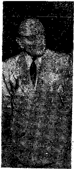
Gal. David Shaltiel, embaixador de Israel, no Brasil.

debeletar de modo radical. A visita, pois, do ilustre homem público de Israel ao Brasil e aos centros israelitas que formam a grande família judaica brasileira, representam uma convergência política de estreita amizade no ponto de vista internacional entre os dois países ami-