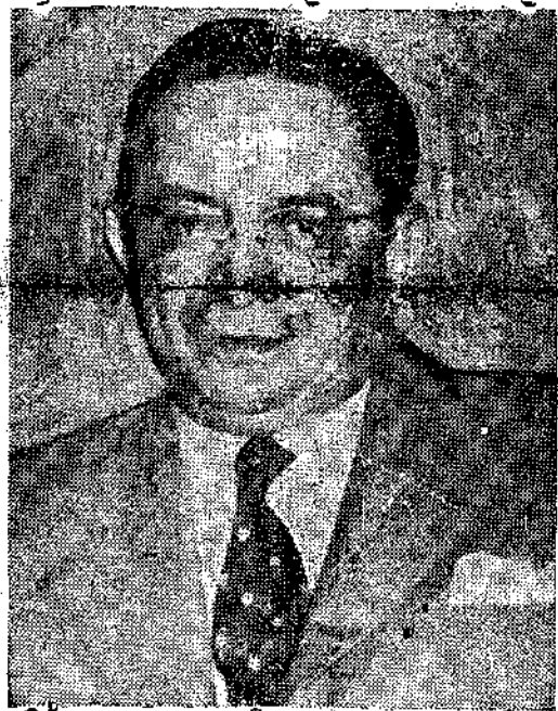
JOAO CAFE FILHO