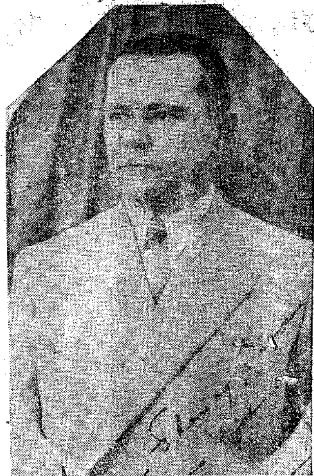
A 8 do corrente o Amazonas inteiro comemorou o segundo aniversario de gloriosa jornada de oposicao e trabalho, o Dr. Leopoldo Amorim da Silva Neves, dignissimo governador constitucional do nosso grande Estado. Embora não se revestisse de caráter oficial as festividades realizadas nesse dia, veio no entretanto demonstrar o quanto de estima e consideração me-

rece o homem publico que tem as rédeas administrativas do governo.